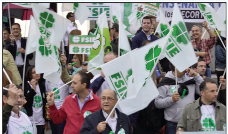
manifestación de FSIE el 24/10 en Madrid

Sin perjuicio de estar muy satisfechos por haber logrado parar el enorme daño que se nos iba a ocasionar, seguimos siendo muy críticos con algunas cuestiones de la LOMCE que son preocupantes. Las Consejerías de Educación van a ser las encargadas de aplicar la LOMCE en sus territorios y, si no abren de forma inmediata un intenso diálogo sobre cómo hacerlo, será muy difícil que no haya reducciones de jornadas y salarios, cierres de unidades y despidos.