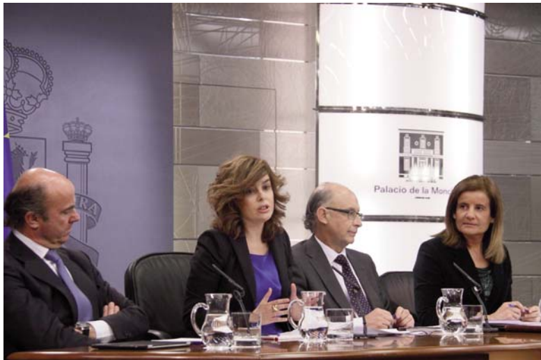
La vicepresidenta, acompañada de los ministros del área económica, en la rueda de prensa posterior al Consejo de Ministros del 30/12/11

El incremento del IRPF que ha aprobado, cuyos efectos en principio se aplicarán en los años 2012 y 2013, se traduce en el sector de la enseñanza privada y discapacidad en una reducción salarial superior al 2% dependiendo de la categoría profesional y del convenio al que se pertenezca. No hay que olvidar que a los docentes de centros concertados se les aplicó en el año 2010, como si fueran funcionarios, la reducción del 5% en salario y se les ha congelado el mismo durante 2011. A todo ello hay que sumar la pérdida de poder adquisitivo en relación al incremento del IPC lo que haría situar la reducción en niveles superiores al 5%.