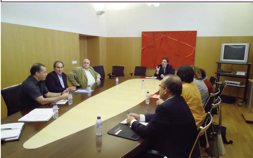
Reunión de los representantes de la enseñanza concertada con el subdirector general de Personal y Centros Docentes

Calendario de fiestas locales para el curso 11/12