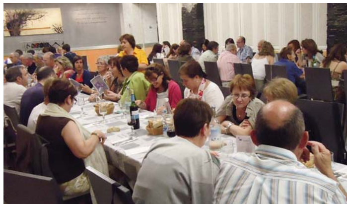
La comida entre recuerdos y bromas

La quinta edición de “La Rioja Tierra Abierta” abrió sus puertas en la Colegiata de San Miguel, uno de los mayores templos construidos en ladrillo de España y emblema del barroco riojano. Se recreaba en la exposición el esplendor de las cortes europeas de los siglos XVI y XVII