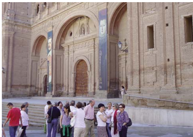
Algunos asistentes a la llegada a la Colegiata

► Afiliados a FSIE-La Rioja disfrutaron de una magnífica jornada de convivencia en Alfaro.