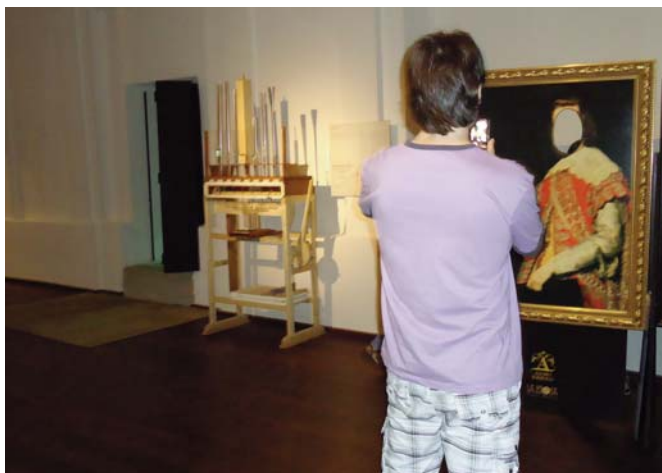
Visita a la exposición “La Rioja Tierra Abierta”

Terminada la visita a la exposición, un pequeño recorrido por la ciudad alfareña, un aperitivo y una comida para fomentar la unión y el hermanamiento entre los afiliados a nuestro sindicato. Fue un buen momento para repasar anécdotas y vivencias del curso pasado y para comentar perspectivas personales y colectivas para el futuro. De vuelta a casa, quedó el recuerdo de la feliz jornada y un paso más en el fortalecimiento de nuestra organización que, día a día, se está convirtiendo en un referente para los trabajadores de la enseñanza privada de La Rioja.