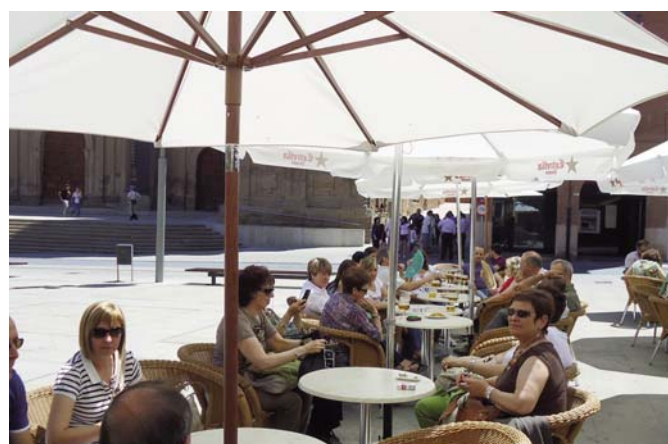
Tras la visita cultural, el aperitivo

norizado por la propuesta expositiva realizada en la colegiata alfareña.